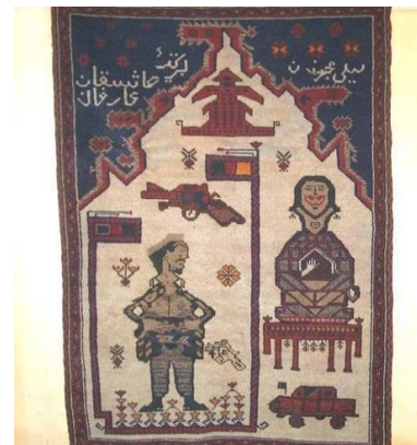
نمونه اول: فرش جنگ (برگزیده عاشقان و عارفان)