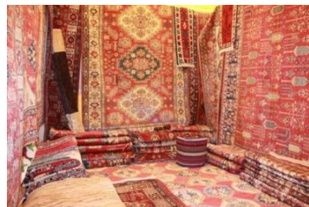
تصویر ۱. فرش فروشی در کابل، (مأخذ url1)

این پهنه‌های هنری در افغانستان در دوران جنگ نیز به تأثیر گذاشته‌است. این هنرمندان توانسته‌اند با استفاده از ادبیات و سبک‌های ادبی، نقوش فرش‌ها را به اجزایی از داستان‌ها تبدیل کنند؛ به‌عنوان مثال، نقوشی که شبیه به کتاب مشهور هزارویک‌شب است، می‌تواند الهام‌گرفته از داستان‌های زیبای خزانه چهارم فرستاده شده باشد؛ از جمله مورد تأثیر قرار گرفتن سبک‌های ادبی، قصه‌های ملی است. این قصه‌ها که تمام مردم با روایت یکی از روزهای عید مبارک رمضان در چهاردهمین قرن برگرفته از حکایات و قصه‌های خود بودند، می‌تواند با تأثیر بین‌المللی در حکم کجاگونه باشند.