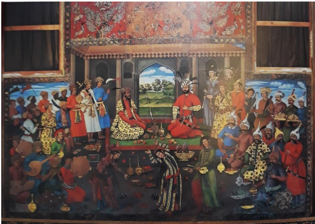
تصویر ۱. کاخ چهل ستون، پذیرایی شاه طهماسب از همایون پادشاه هند (جوانی و آقاجانی‌اصفهانی، ۱۳۸۶: ۷۲)

شاه طهماسب در اوایل سلطنتش به زمینه‌های مختلفی هنری از جمله موسیقی علاقمند بوده و جدای از موسیقی مجلسی، از فعالیت موسیقیایی رسمی در سازمان نقاره‌خانه و موسیقی‌دانان آن نیز حمایت می‌کرد؛ اما به مرور به دلیل تعصبات مذهبی به اهالی هنر به ویژه موسیقی روی خوش نشان نداد. پریسا کریمی در این رابطه می‌نویسد: «شاه طهماسب نیز که ابتدا به موسیقی روی خوش نشان داده بود، توبه کرد. او فرمانی مبتنی بر ممنوع شدن موسیقی در کشور و شکستن سازها و ضبط آنها