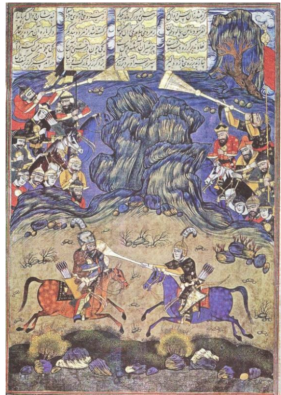
تصویر ۷. ساز کرنا، در نگاره نبرد رستم با برزو، شاهنامه قره‌چقای خان، اصفهان، ۱۰۵۸ هجری (آژند، ۱۳۸۹: ۶۳۱)

سفرنامه‌نویسان بسیاری در مکتوبات خود به نقش موسیقی و نواختن ساز در مناسک مذهبی شیعیان در عصر صفوی اشاره کرده‌اند. آدام اولتاریوس در سفرنامه خود مراسم عزاداری حضرت علی (ع) را این چنین توصیف می‌کند: «در آن مراسم عزاداری حضرت علی (ع) نی‌لیک، سنج، تمبک و طبل نظامی می‌نواختند» (اولتاریوس: ۱۳۶۳: ۷۵۷۳). گارسیا دسیلوا فیگوئروا سفیر اسپانیا در دربار شاه عباس اول، در توصیف مراسم عاشورا