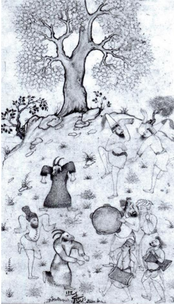
تصویر ۵. لوتی‌های دوره‌گرد، نگاره‌ای از سلطان محمد، ۹۲۶ ق، گالری هنر فریر، واشنگتن (ذاکر جعفری، ۱۳۹۶: ۱۳۰)