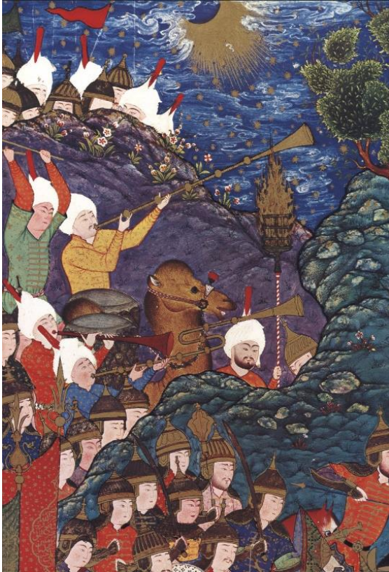
تصویر ۸. سازهای کرنا، مارنای، سورنای و نقاره در نگاره نبرد تورانیان با ایرانیان، شاهنامه شاه طهماسبی (CARY WELCH، ۱۹۷۶: ۱۲۸)

۷۲-۷۱-۵۹). در یک نگاه کلی در دوران صفوی، «گروه‌های نقاره‌خانه عمدتاً در راستای دو هدف عمده دربار به کارگرفته می‌شدند: اول، گروه نقاره‌ای که علاوه بر شرکت در مجالس بزم، در فضای آزاد برای تحقق اهداف نظامی، سیاسی و اجتماعی حکومت انجام وظیفه می‌کردند؛ دوم، گروه‌های بزمی که وظیفه سرگرمی درباریان را بر عهده داشتند» (میثمی، ۱۳۸۹: ۱۲۹). می‌توان این‌گونه بیان کرد که، نقاره‌خانه به عنوان مهم‌ترین سازمان موسیقی کشور در عصر صفوی، مرکز فعالیت رسمی موسیقیایی و محفلی برای اهالی هنر موسیقی و تبادل اطلاعات در این زمینه بوده است.