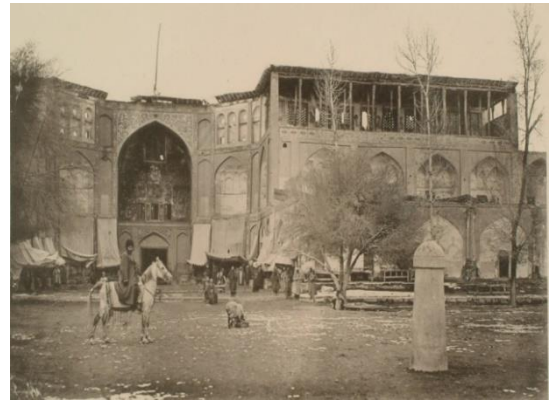
تصویر ۶. نقاره‌خانه صفوی میدان نقش جهان اصفهان

۷۲-۷۱-۵۹). در یک نگاه کلی در دوران صفوی، «گروه‌های نقاره‌خانه عمدتاً در راستای دو هدف عمده دربار به کارگرفته می‌شدند: اول، گروه نقاره‌ای که علاوه بر شرکت در مجالس بزم، در فضای آزاد برای تحقق اهداف نظامی، سیاسی و اجتماعی حکومت انجام وظیفه می‌کردند؛ دوم، گروه‌های بزمی که وظیفه سرگرمی درباریان را بر عهده داشتند» (میثمی، ۱۳۸۹: ۱۲۹). می‌توان این‌گونه بیان کرد که، نقاره‌خانه به عنوان مهم‌ترین سازمان موسیقی کشور در عصر صفوی، مرکز فعالیت رسمی موسیقیایی و محفلی برای اهالی هنر موسیقی و تبادل اطلاعات در این زمینه بوده است.